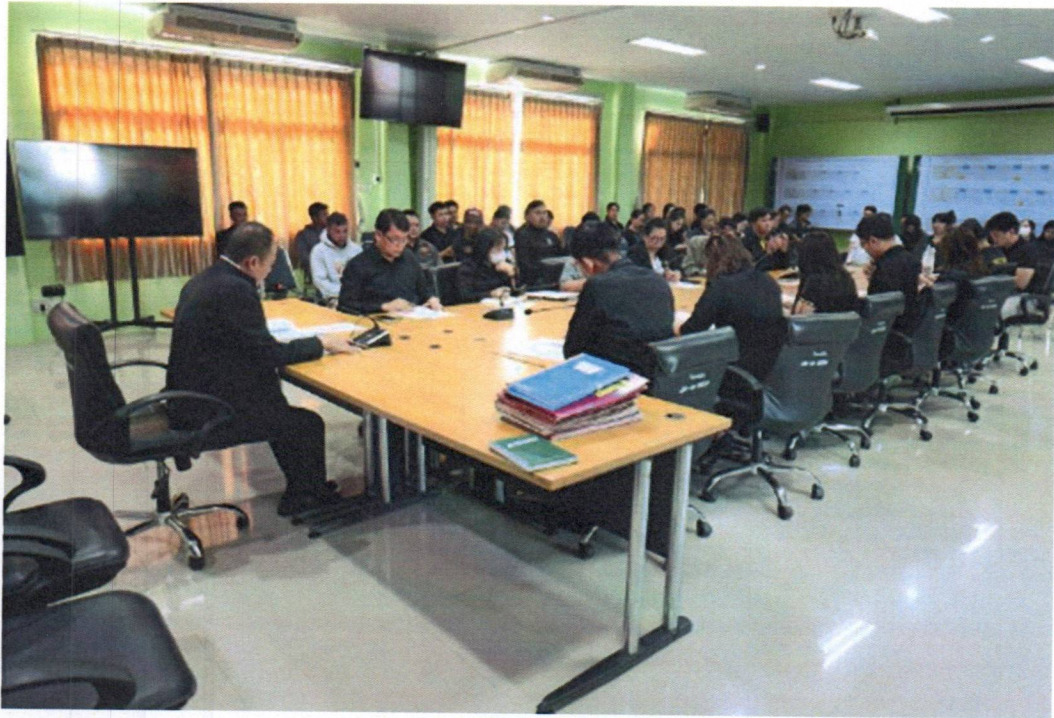
รูปภาพประกอบการประชุมประจำเดือน มกราคม ๒๕๖๙